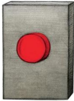
ビル・コッターさく